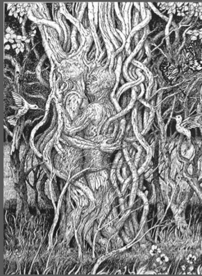
Bild: Heiliger Baum Tuschezeichnung 40 x 50 cm