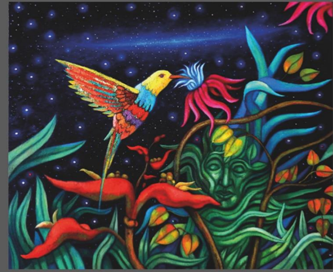
Bild: Der Geist des Lebens Öl auf Leinwand 50 x 60 cm